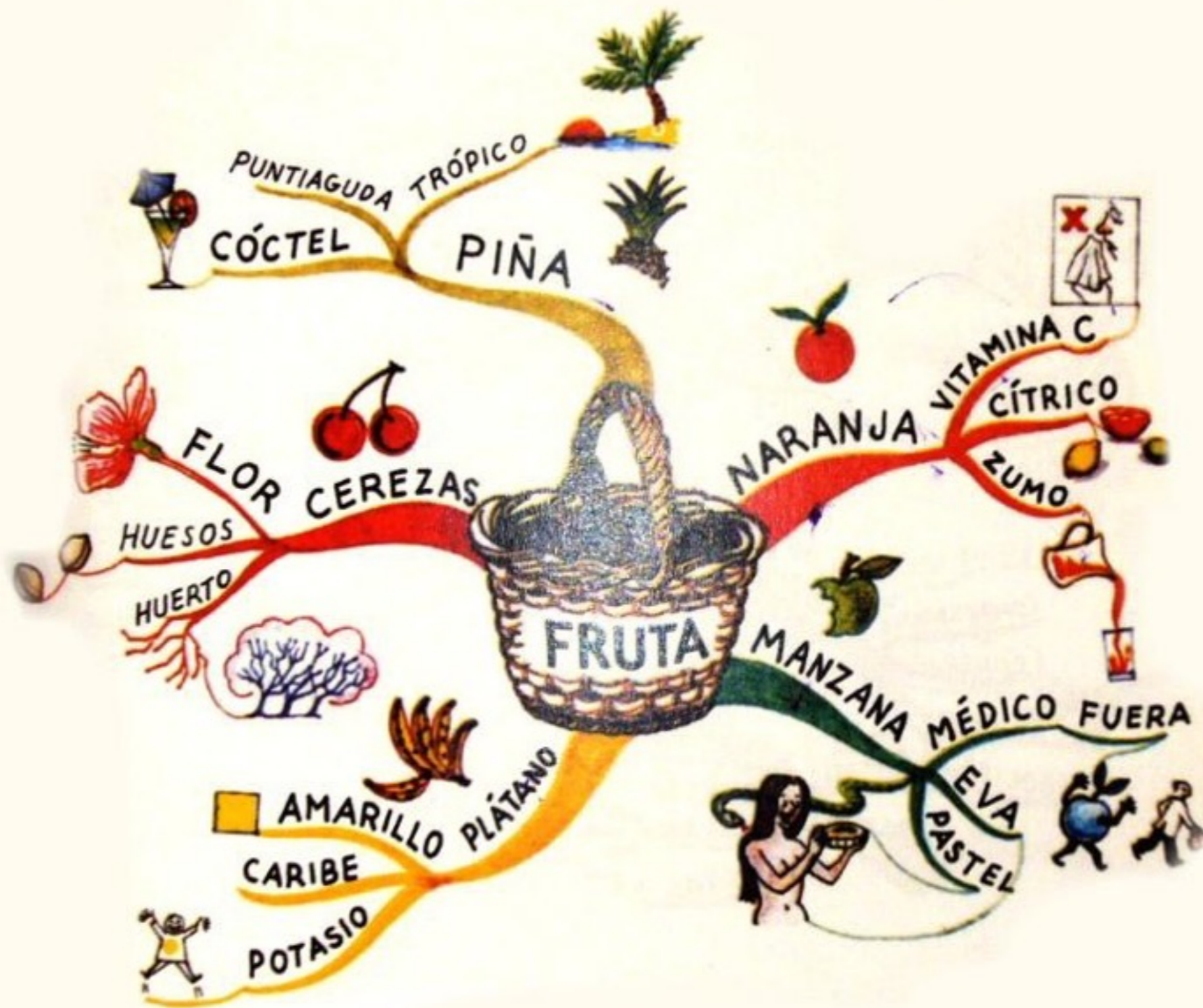
Mapa mental 1- La Fruta